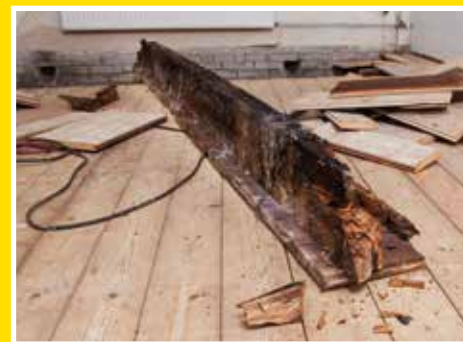
Tijd voor renovatie!

Veel oudere woningen tot aan de jaren '80 uit de vorige eeuw kampen met een constructief slechte en niet of nauwelijks geïsoleerde begane grondvloer. Reno Acero® biedt dé oplossing door de snelle montage en afwerking en het langdurige gemak van een nieuwe vloer die aan alle actuele voorwaarden voldoet. Deze renovatievloer bestaat uit stalen liggers en vulelementen van geëxpandeerd polystyreen (EPS). Ook voor uit- en aanbouwen is Reno Acero® een snel en passend vloersysteem.